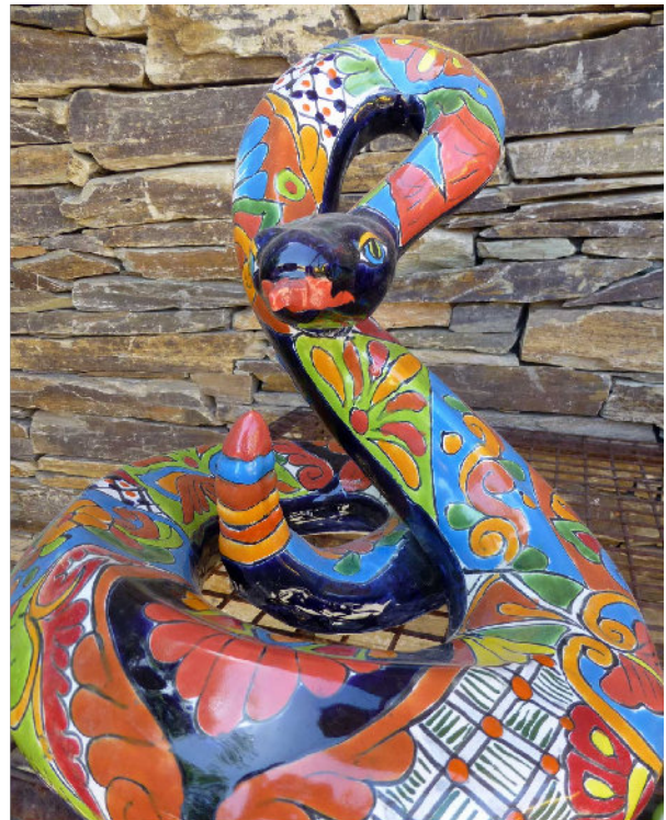
Bilder: Ground Squirrel und Klapperschlange