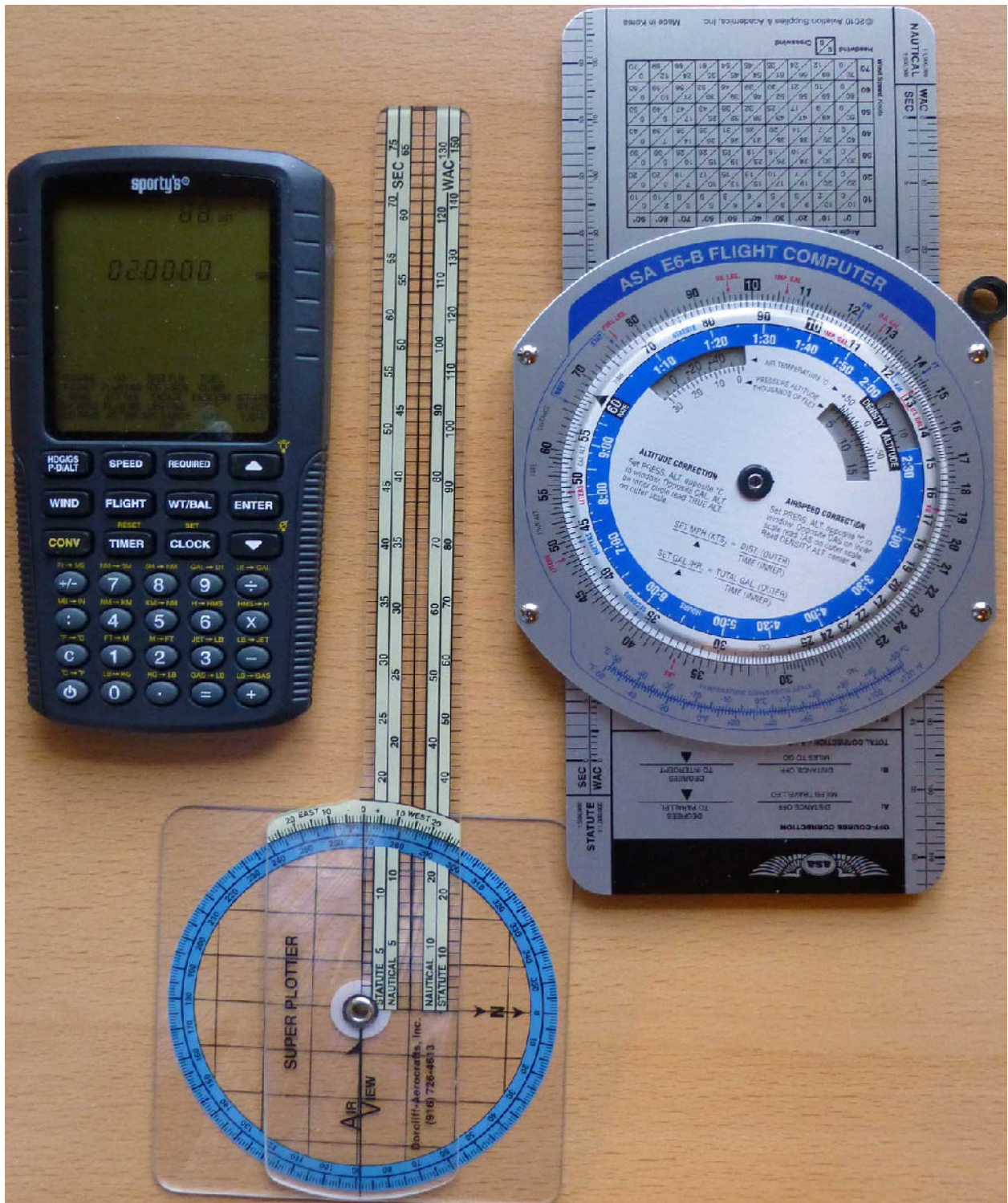
Bild: Die Hilfsmittel für Navigationsaufgaben

Deshalb habe mir dann noch kurz vor der Reise die elektronische Version des Navigationsrechners bestellt. Dieser Rechner liefert auch passende Ergebnisse für niedrige Glider-Geschwindigkeiten, und außerdem hat er einen einfachen Taschenrechner für alle Aufgaben, die man nicht im Kopf ausrechnen kann (Weight and Balance, Gleitwinkel, Entfernungen etc.).