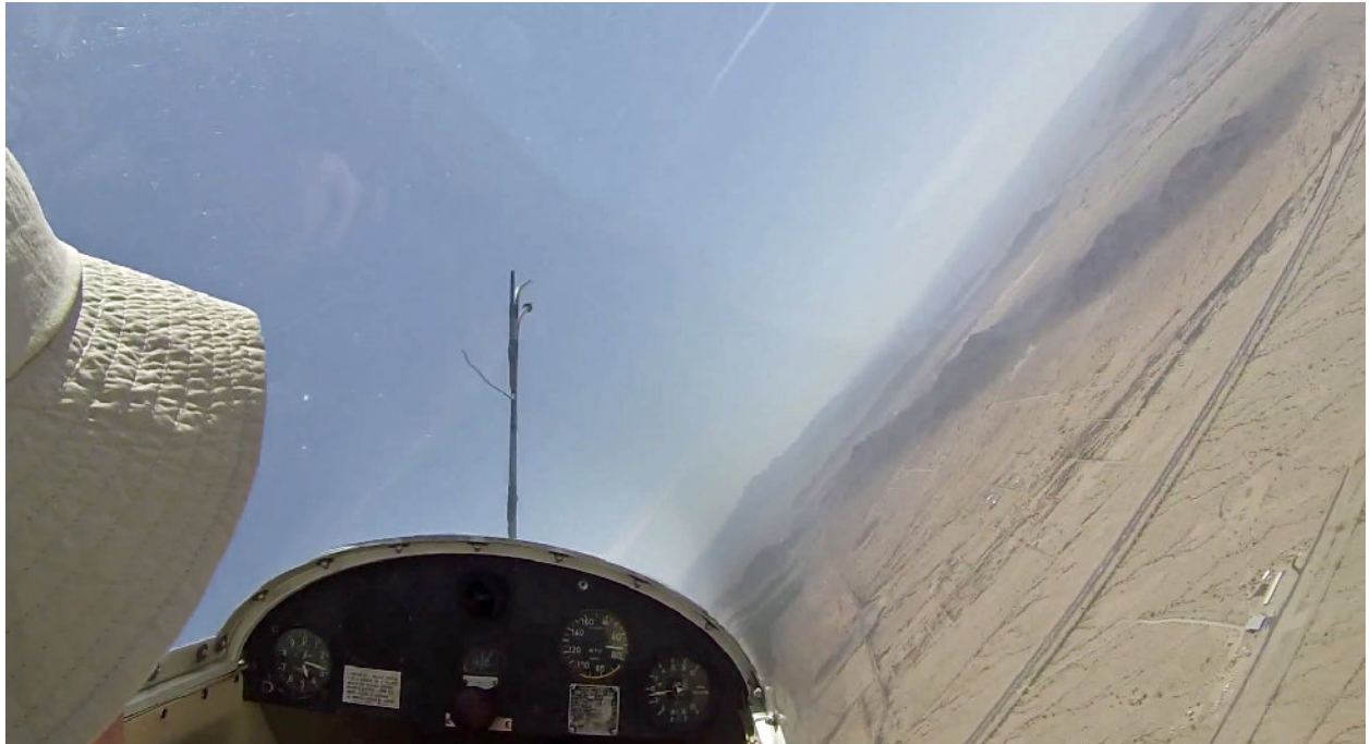
Bild: Steep Turns über Estrella