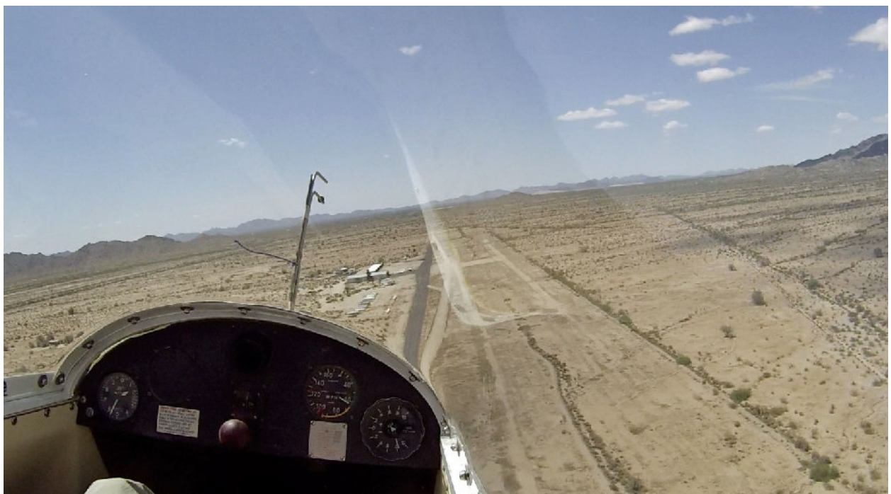
Bild: Eindrehen ins Final

Dabei ist natürlich ständig die Höhe im Auge zu behalten, denn bei 1000ft AGL muss sich der Glider am Initial Point des Downwinds zur Landung befinden. Bei ca. 2000ft MSL drehe ich in den Base Teil und fahre die Spoiler schon mal leicht aus. Eindrehen ins Final mit nicht zu viel Querlage und 60 mph.