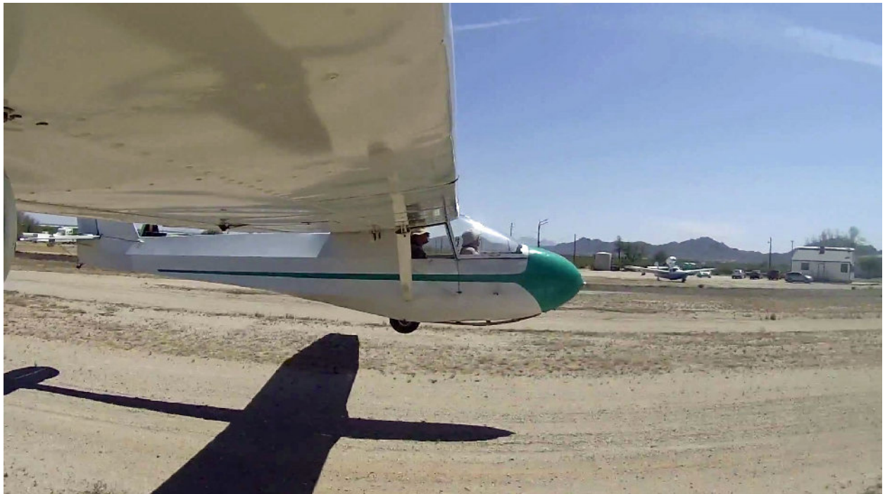
Bild: Kurz vor dem Aufsetzen

Jetzt kommt es darauf an, die Landung mit Hilfe der Spoiler und ggf. eines Slips so zu berechnen, dass der Glider in einem Bereich von 200ft vor dem Windsack zum Stehen kommt – ebenfalls eine entscheidende Aufgabe der praktischen Prüfung.