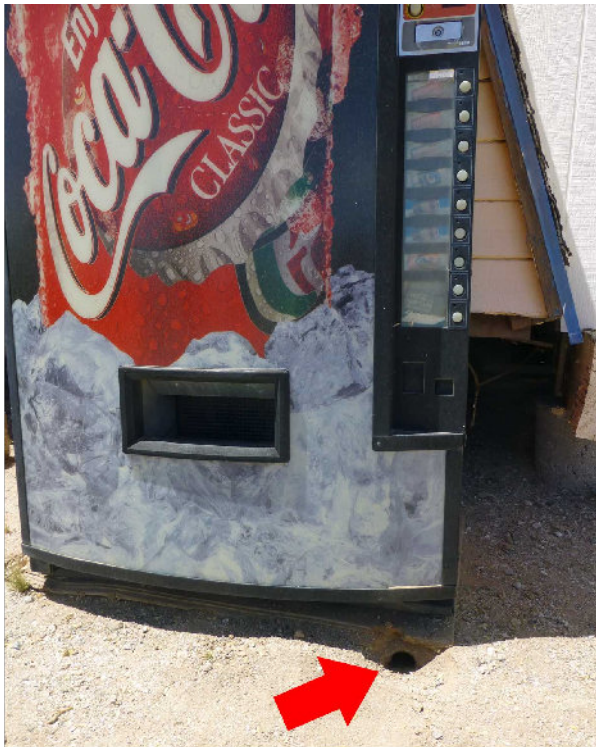
Bilder: Vorsicht: Rattle Snake

Apropos Klapperschlange, eine wohnte in einer Höhle unter dem Coca-Automaten auf unserem Airport und zischte (oder klapperte), wenn man sich dem Automaten näherte.