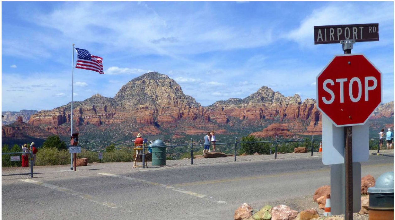
Bild: Aussichtspunkt am Airport von Sedona

Auch eine Tour nach Norden war noch möglich. Hier standen Sedona, Flagstaff und ein gewaltiger Einschlagkrater eines Meteoriten auf dem Programm.