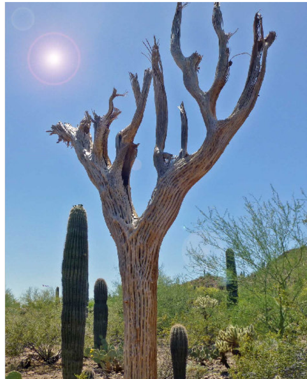
Kakteen im botanischen Garten von Phoenix